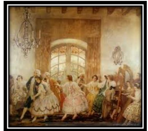
"Baile en Santiago antiguo", 1917.