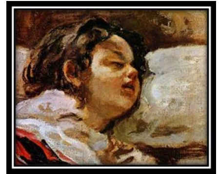
"El niño dormido", 1900

PEDRO SUBERCASEAUX: fue pintor e historietista chileno nacido en Italia en 1880. Fue célebre por sus obras que ilustran la historia y las costumbres de Chile.