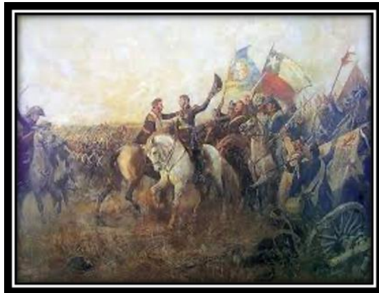
"El abrazo de Maipú", 1820