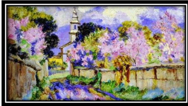
"Calle de Limache", 1900