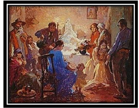
"Velorio del angelito".1920.