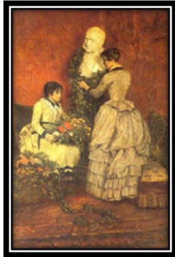
“En el rincón del salón”,