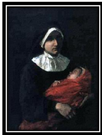
“La hermana de la caridad”,