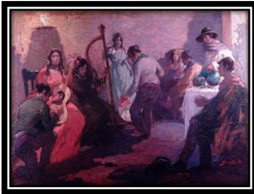
"La zamacueca", 1920