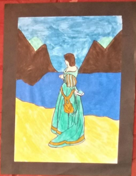
La Carta Pedro Lira 1885- 1890