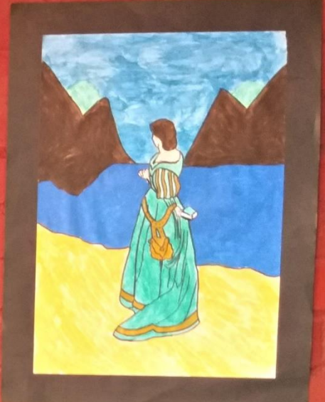
La Carta Pedro Lira 1885- 1890