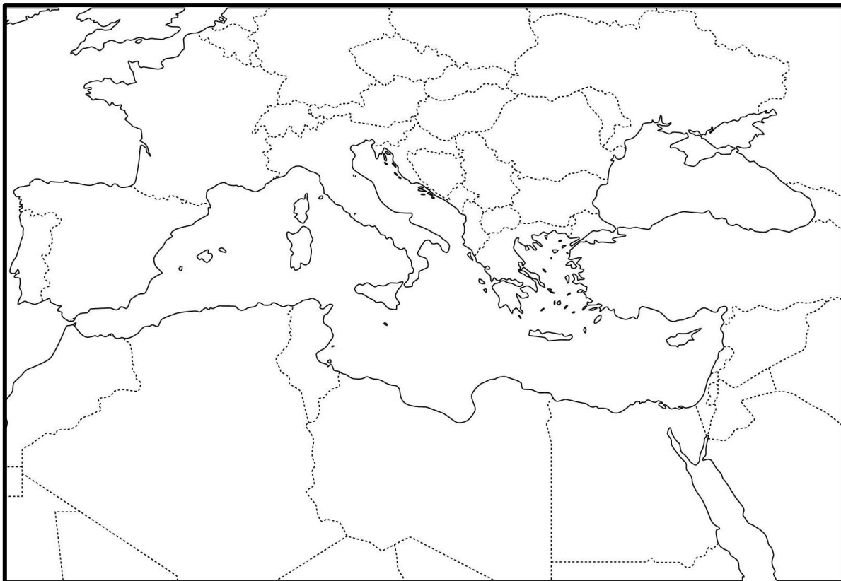
MAPA N° 1: mar Mediterráneo