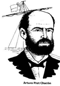
Arturo Prat Chacón

¡Los esperamos con mucho entusiasmo para conmemorar el mes del Mar de una manera diferente, pero muy constructiva!