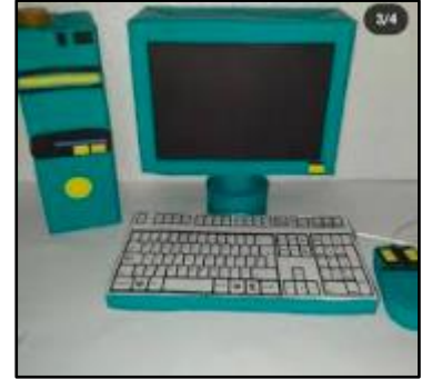
Computador de escritorio

Semana 2 (6/04): Decoración del computador con materiales de desecho